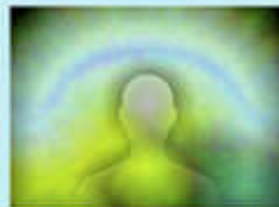
Relax after drinking Biocera water