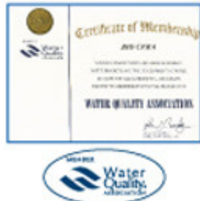
Water Quality Association