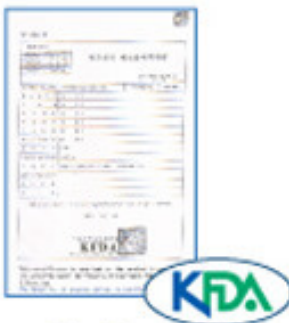
The Korean Food and Drug Administration