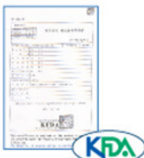
The Korean Food and Drug Administration