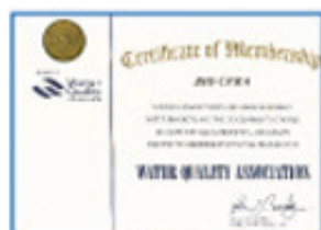
Water Quality Association