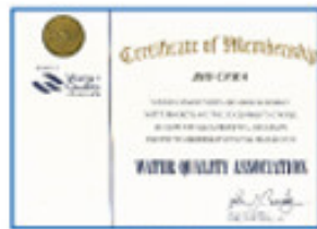
Water Quality Association