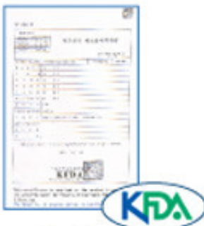
The Korean Food and Drug Administration