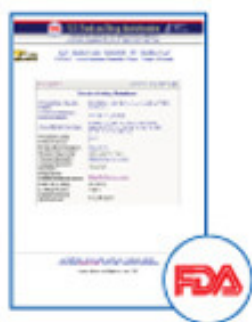
US Food and Drug Administration