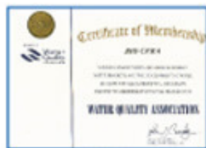
Water Quality Association