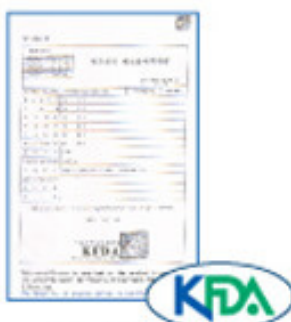
The Korean Food and Drug Administration