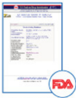
US Food and Drug Administration