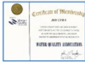
Water Quality Association