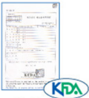
The Korean Food and Drug Administration