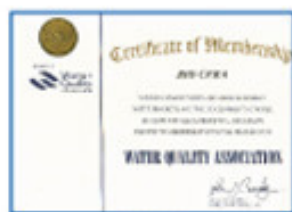
Water Quality Association